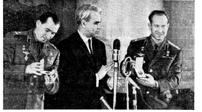
Летчик-космонавт Павел Беллев, президент Академии наук СССР М. Келдыш и летчик-космонавт Алексей Леонов на пресс-конференции, посвященной полету космического корабля «Восход».

Вопросы не иссякают. Кто-то спрашивает о будущем космонавтики, кто-то спрашивает о будущем космонавтики, кто-то спрашивает о будущем космонавтики. Вопросы не иссякают. Кто-то спрашивает о будущем космонавтики, кто-то спрашивает о будущем космонавтики, кто-то спрашивает о будущем космонавтики.